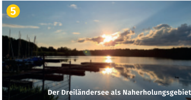
Der Dreiländersee als Naherholungsgebiet