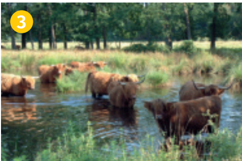
Hochlandrinder im Witte Venn