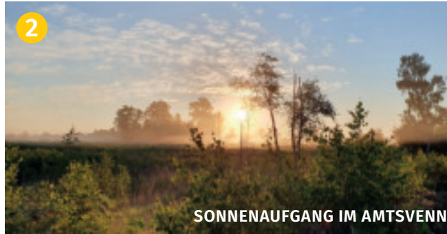
SONNENAUFGANG IM AMTSVENN