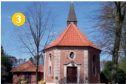
Die Heilig-Kreuz-Kapelle in der Bauerschaft Ahle