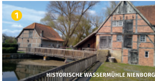
HISTORISCHE WASSERMÜHLE NIENBORG

Was ist GPX? GPX ist die Abkürzung für GPS Exchange Format, ein Dateiformat zum Austausch und zur Archivierung von GPS-Daten. Als .gpx können Wegpunkte, Routen und Tracks gespeichert werden.