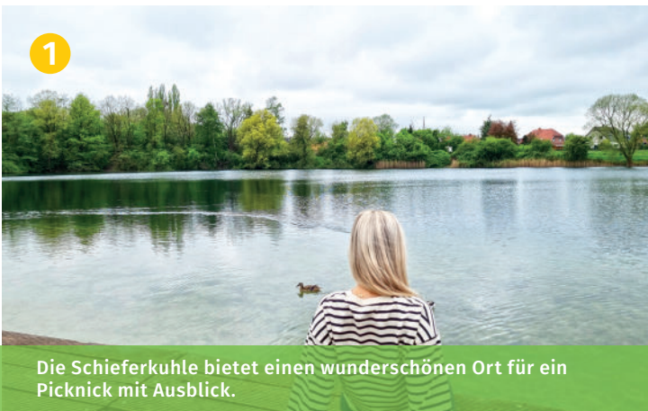
Die Schieferkuhle bietet einen wunderschönen Ort für ein Picknick mit Ausblick.